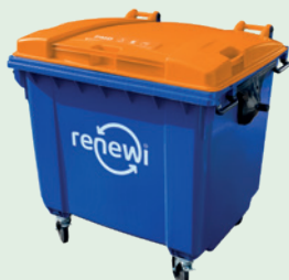
Inzameling in 1100 liter rolcontainers (± 8000 bekers per container)